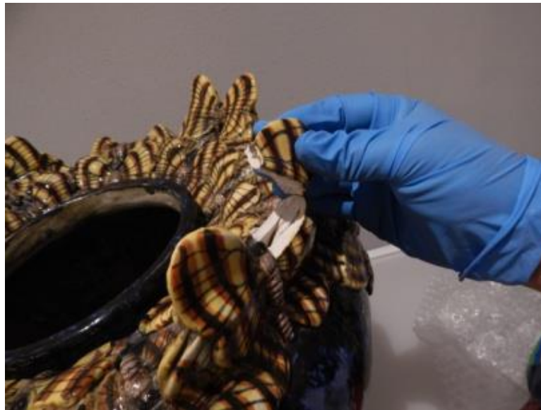
Figura 12. Intervención emergente durante montaje de exposición

Durante el traslado de las piezas que entran al Museo para las exposiciones, en ocasiones éstas sufren daños durante el traslado, por lo que si entre ambas direcciones llegan al acuerdo de que se intervengan, el Departamento realiza actividades menores de restauración. De esta manera las piezas pueden ser exhibidas de la manera adecuada. (Fig. 12).