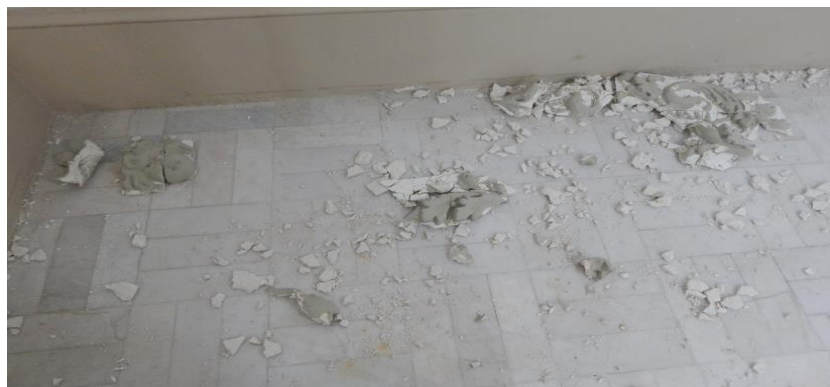
Figura 8. Colapsos de yesería de techo por filtraciones

Debido a la condición de las cubiertas y el temporal de lluvias pasado, surgieron deterioros y emergencias, mismas que se relatan en reportes puntuales elaborados por el Departamento, los cuales la Dirección remitió a la comitiva para que los considere en el Proyecto de Restauración. Se espera que dicho proyecto sea ejecutado en su primea etapa antes de finales de año (Fig. 8).