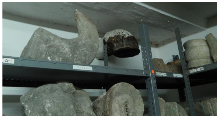
Figura 6. Bodega 8

Es posible observar también tubos y orificios como parte de la función que este sitio tuvo como cisterna, las tuberías se encuentran oxidadas y afectan directamente la conservación del acervo (Figs. 6 y 7). En cuanto a las instalaciones eléctricas, se observa que están expuestas en algunos casos sin conductos de protección. Allí hay también un cuarto de máquinas en el que se encuentran las instalaciones del elevador, así como las tuberías de los servicios sanitarios.