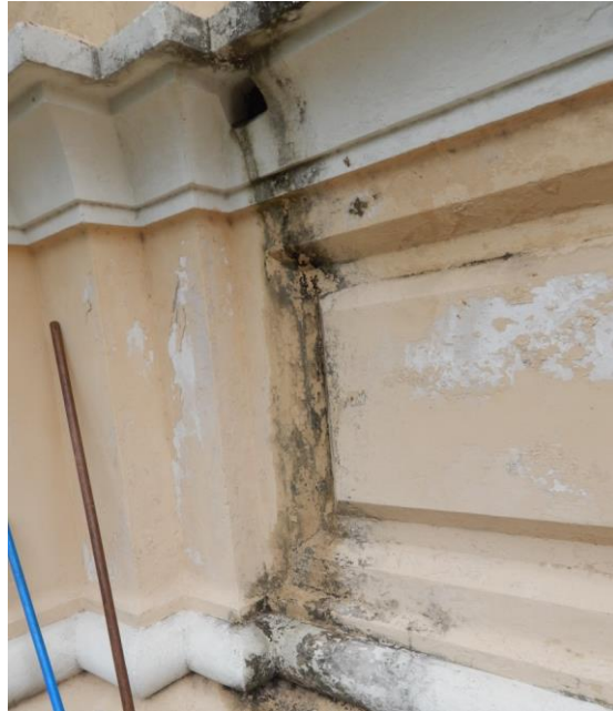
Figura 2 microorganismos en fachadas por instalaciones de desagüe

Las filtraciones de agua por las cubiertas han provocado inestabilidad estructural en el inmueble, motivo por el cual en época de lluvias se han perdido aplanados en techos y muros del ático; desprendimientos de la decoración de yesería en salas de exhibición, goteras y pérdida de cohesión en algunas cubiertas; frentes de humedad (Fig. 1); grietas y fisuras reflejadas en el interior del edificio; así mismo es muy evidente en algunas zonas en donde a causa de la humedad han florecido microorganismos como hongos, moho y líquenes (Fig. 2).