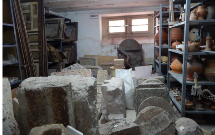
Figura 5. Bodega 14

En su interior cuenta con 14 salas (Fig. 4) en las que se distribuye la totalidad del acervo en resguardo. Los objetos se clasificaron por temporalidad y por material constitutivo, y hoy en día la colección ha excedido la capacidad del espacio, motivo por el cual muchos objetos se encuentran directamente sobre el piso o apilados en anaqueles (Fig. 5).