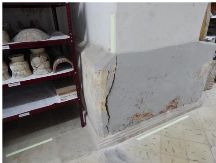
Figura 3. Grietas en muros