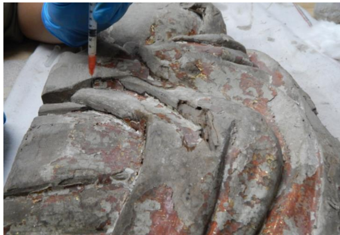
Figura 11. Estabilización de obra

proteger las colecciones en el ámbito legal, de manera que puedan hacerse efectivos los seguros en caso de algún siniestro (Fig. 11).