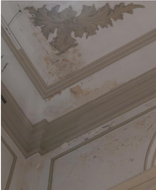
Figura 1 Frentes de humedad en salas de exhibición