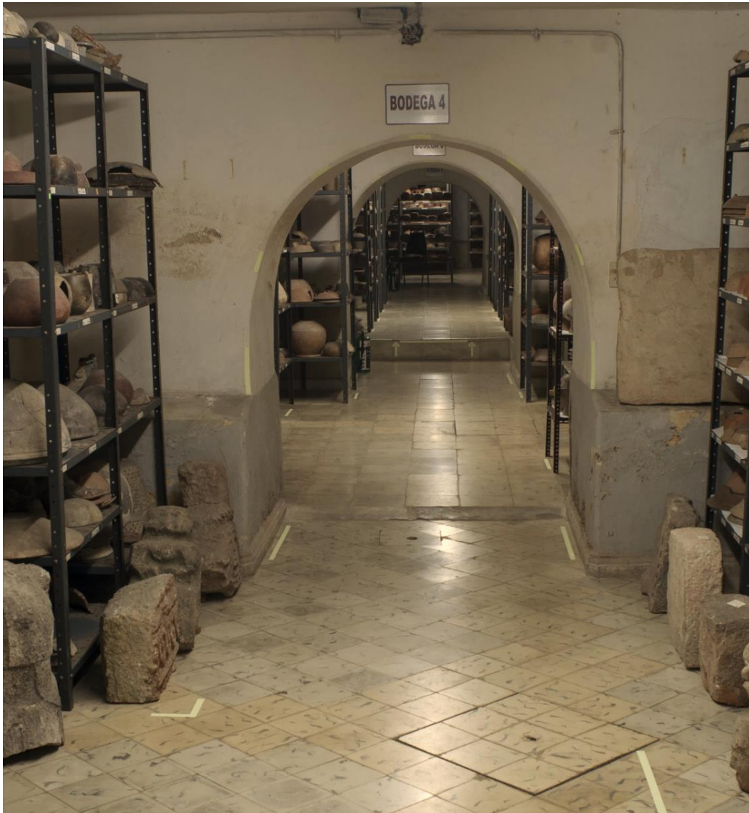
Figura 7. Bodega

Aunque la bodega cuenta con señalización interna, rociadores y extintores, éstos resultan insuficientes. Cabe agregar que al momento de la creación del Departamento de Conservación y Restauración no existía un proyecto de conservación preventiva de las colecciones, ni un plan de acción en caso de contingencias específico para las colecciones.