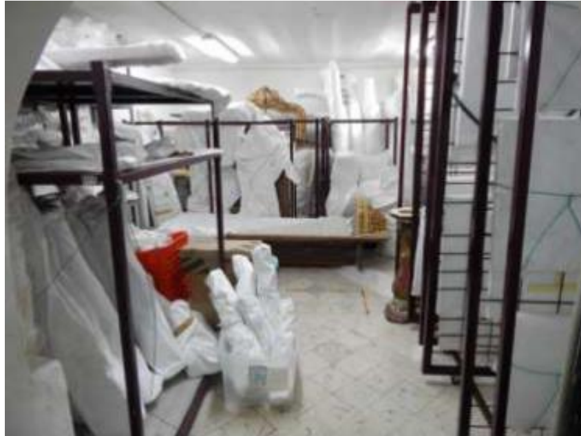
Figura 10. Bodega que resguarda el acervo de arte colonial en madera

El retraso en la ministración de los recursos del Proyecto, determinó la imposibilidad de realizar todas actividades planeadas. Sin embargo, con sólo acciones mínimas en el área de resguardo como la redistribución en los anaqueles y un embalaje adecuado para resguardar las piezas, el estado de conservación la colección de Arte Colonial en Madera ha mejorado enormemente (Fig. 10).