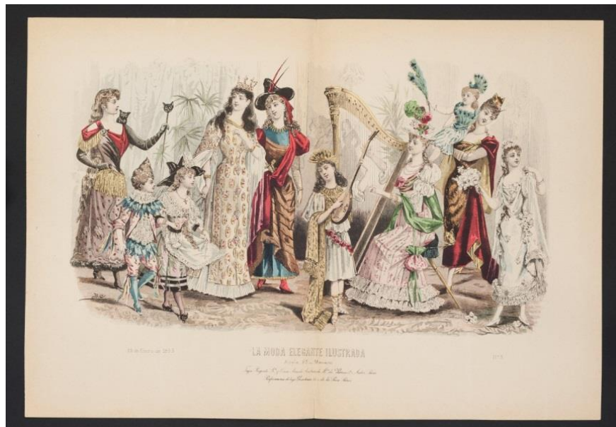
FIGURA 6. Lámina que muestra una fiesta de disfraces. Museo Nacional de Historia.

Otro aspecto que se puede observar, aunque quizás de forma idealizada, son las costumbres, la vida cotidiana, las diversas temporadas de moda y la influencia de las estaciones del año en el vestir. De esta manera, se presentan láminas que muestran fiestas de disfraces, visitas al parque o al hipódromo, ceremonias de matrimonio, así como paseos por la costa o días de entretenimiento en lagos congelados para practicar patinaje.