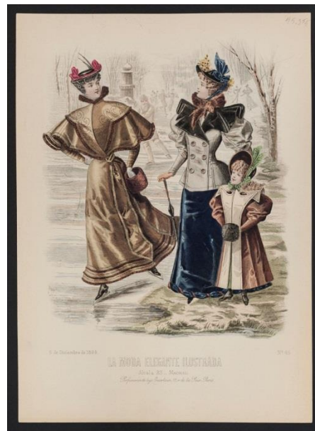
FIGURA 8. Lámina que muestra a una mujer patinando sobre un lago congelado. Museo Nacional de Historia.