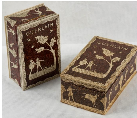
FIGURAS 1. Cajas de perfume de Guerlain, posiblemente corresponden a L’Heure Bleue (1912). Museo Nacional de Historia.

El Museo Nacional de Historia (MNH) resguarda 166 láminas impresas con figurines de la revista La Moda Elegante Ilustrada con una leyenda que incluye la palabra “Guerlain” a pie de imagen, 1 así como dos lotes que engloban dos cajas de perfume Guerlain y cuyas fragancias posiblemente corresponden a L’Heure Bleue (1912) y Vol de Nuit (1933).