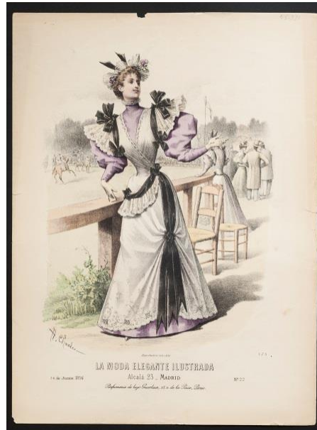
FIGURA 7. Lámina que muestra una visita al hipódromo. Museo Nacional de Historia.