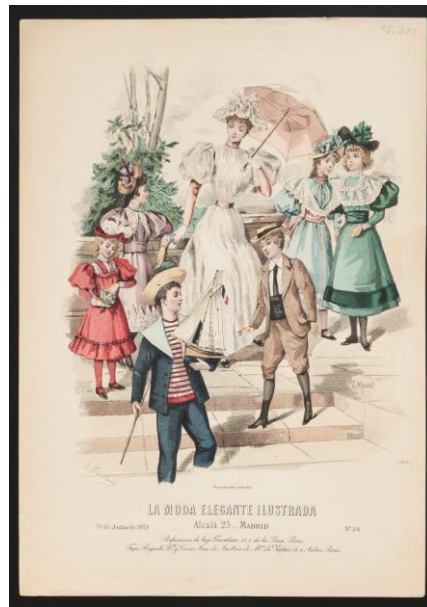
FIGURA 12. Variedad de tintas presentes en una lámina. Museo Nacional de Historia.

En cuanto a los materiales, se identificó que el soporte está hecho con pulpa de fibras maderables, independientemente de que el papel muestre una superficie porosa o semi-lustrosa. 21 También es posible observar diferencias en el proceso de impresión ya que existen láminas que poseen sólo cuatro tintas, mientras que otras oscilan entre 16-18 tintas de diverso color. Aún hace falta vincular las diferencias encontradas con posibles cambios de lugar de imprenta, disponibilidad de materiales, costo del ejemplar o ediciones extraordinarias de figurines.