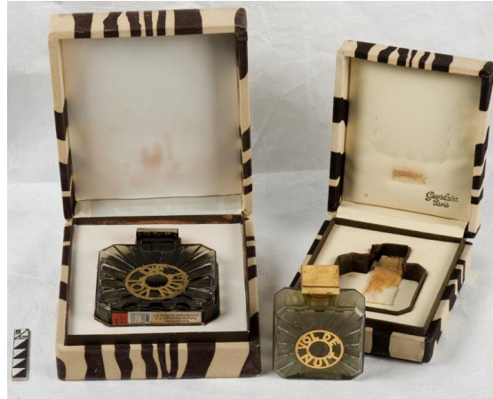
FIGURA 2. Cajas de perfume de Vol de Nuit (1933) de Guerlain. Museo Nacional de Historia.

Tras identificar la dificultad que implica mantener criterios uniformes ante una muestra de semejante magnitud y el reto existente en conservar objetos con estrechos vínculos a aromas fugaces, el Museo convocó prestadores de servicio social en las principales escuelas de conservación y restauración del país.