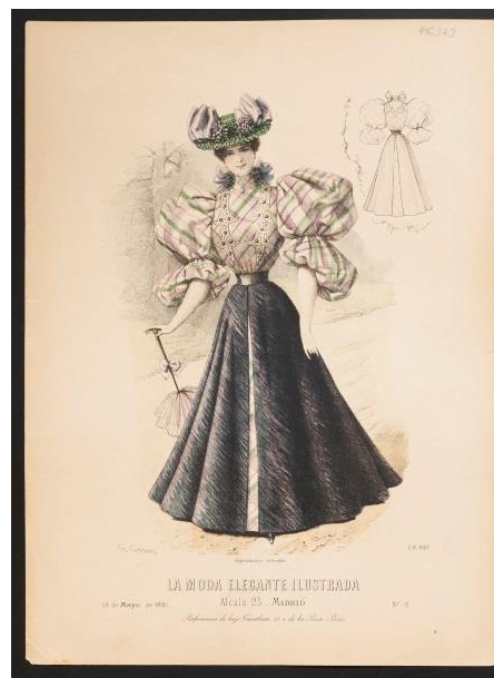
FIGURA 5. Lámina fechada en 1895, falda de forma cónica y mangas “tipo jamón”. Museo Nacional de Historia.