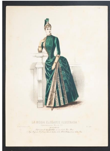
FIGURA 4. Lámina fechada en 1886, conjunto de polisón con mangas largas y ajustadas en los brazos. Museo Nacional de Historia.