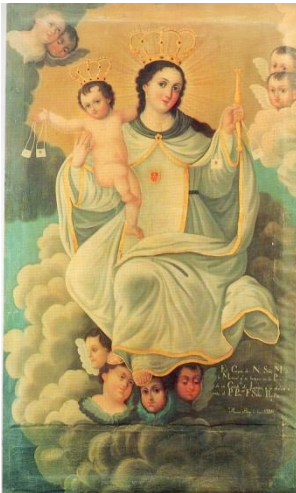
Imagen 3. Copia que se encuentra en el templo de San Luis Potosí

Las muestras estratigráficas permitieron observar que probablemente se trata de una reutilización total del lienzo para la nueva imagen. Además también se percibió que sólo en algunas zonas se le añadieron dos bases de preparación sobre el estrato pictórico inicial y en otras zonas se aplicó directamente.