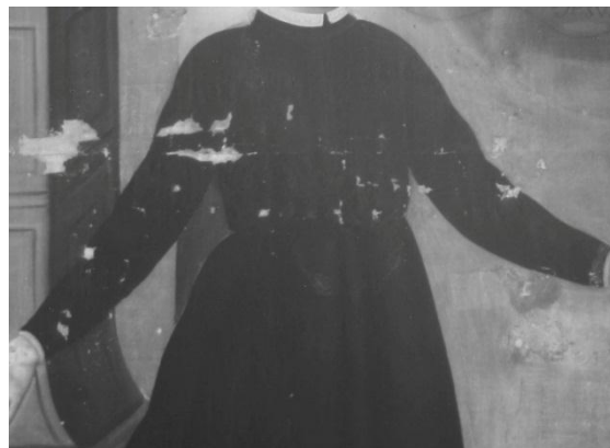
Imagen 8. Detalle de pulseras y collares de eslabones, con radiaciones infrarrojas

El collar, pulseras y cinturón de eslabones que porta el personaje principal, se observaron durante el proceso de limpieza del velado, así mismo se realizaron estudios radiográficos e infrarrojos que corroboraron de manera contundente la advocación hacia San Cayetano de Thiene. Así mismo se localizaron retoques en la mano y el rostro del santo, el manto de la Virgen y de Jesús, partes de la nube, el cielo, el piso y el ramo de flores.