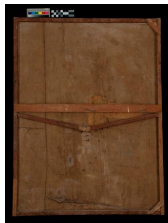
Imagen 1. Reverso de la obra donde se muestran los añadidos de intervenciones anteriores.

A continuación se expone brevemente algunas particularidades y resultados obtenidos de estas investigaciones históricas, iconográficas, así como de los análisis científicos realizados a cada obra, los cuales permitirán un acercamiento a la materialidad y valoración de las mismas.