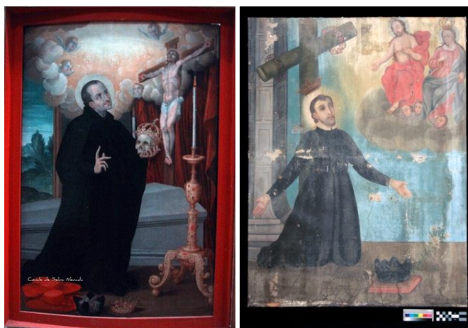
Imágenes 4 y 5. San Francisco de Borja y Trastámara. Alfonso López de Herrera. La Profesa. Ciudad de México. (izq) y San Cayetano de Thiene. Anónimo. Convento de Nuestra Señora de la Merced. (der)

La obra denominada San Cayetano de Thiene es un óleo sobre tela de formato cuadrangular, aproximadamente de siglo XIX. Es importante mencionar que dentro del convento que albergaba la obra se ignoraba la advocación del santo, por lo que inicialmente se consideró que la representación iconográfica bajo investigación pertenecía a San Francisco de Borja y Trastámara, debido a algunos atributos y parecido fisonómico. 4 Sin embargo, no se localizó la calavera imperial, que es un atributo indispensable para este personaje. A lo largo del proceso de restauración investigación se encontraron algunos atributos en la pintura que incrementaron más la similitud con San Cayetano de Thiene, por lo que se consideró más apropiada esta denominación.