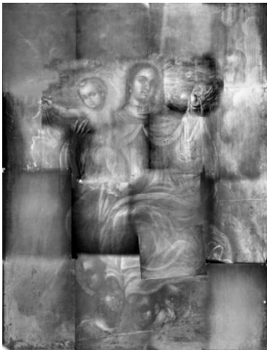
Imagen 2. Armado radiográfico que muestra la capa pictórica inferior.

En cuanto al textil se le habían aplicado un par de parches para sanar la rotura provocada por algún golpe, además en esta misma zona, específicamente del lado izquierdo del manto de la virgen, tenía una pasta de color gris para cubrir el área. Las diferentes características de los materiales empleados nos hablan de temporalidades distintas de intervención.